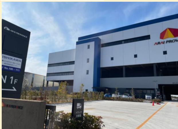
イシカワコーポレーション倉庫外観